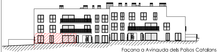
Façana a Avinguda dels Països Catalans